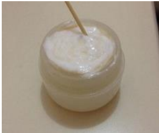
Gambar 4.5. Losion yang mengandung ekstrak kulit petai

Losion yang digunakan adalah losion plain sebanyak 60 mL. Losion tersebut dicampurkan dengan ekstrak kulit petai dengan perbandingan 4:1 (60 mL losion : 15 mL ekstrak kulit petai). Gambar 4.5 adalah losion yang sudah dicampur dengan ekstrak kulit petai.