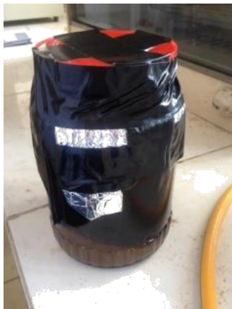
Gambar 5.2. maserati serbuk kulit petai

Pemilihan pelarut etanol 70%, didasarkan pada penelitian yang telah dilakukan oleh Hasim, dkk, 2015. Pada penelitian tersebut, maserati dilakukan dengan menggunakan variasi 3 jenis pelarut, yaitu n-hexane, etil asetat dan etanol 70%. Proses maserati yang menghasilkan yield ekstraksi paling banyak adalah dengan pelarut etanol 70% yaitu sebesar 12,13%. dilakukan oleh Hasim, dkk, 2015. Pada penelitian tersebut, maserati dilakukan dengan menggunakan variasi 3 jenis pelarut, yaitu n-hexane, etil asetat dan etanol 70%. Proses maserati yang menghasilkan yield ekstraksi paling banyak adalah dengan pelarut etanol 70% yaitu sebesar 12,13%.