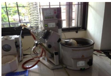
Gambar 5.3. Proses Evaporasi

Setelah dilakukan maserati selama 24 jam, tahapan selanjutnya adalah proses evaporasi pelarut yang dilakukan di Laboratorium Kimia akademi farmasi surabaya. Proses ini bertujuan untuk menguapkan pelarut etanol. Langkah pertama, hasil maserati kulit petai diambil sebanyak 500 mL dan disaring menggunakan corong Buchner dan pompa vakum. Cairan yang telah tersaring dimasukkan ke dalam labu rotary evaporator dan suhu pada alat rotary evaporator disesuaikan dengan suhu titik didih pelarut etanol, yaitu 70° C. Proses evaporasi berlangsung selama 5 jam dan menghasilkan 53 mL ekstrak kulit petai. Proses evaporasi ditampilkan pada gambar 5.3.