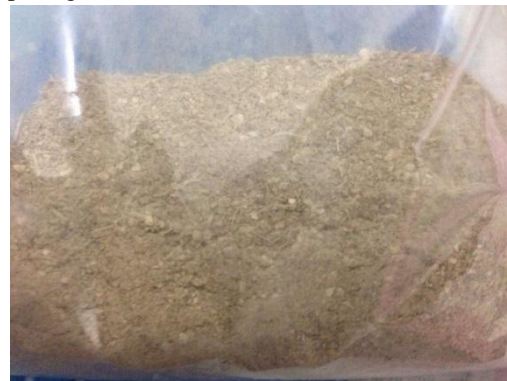
Gambar 5.1. Serbuk Kasar Kulit Petai

Kulit petai yang digunakan dalam penelitian ini diambil dari daerah pasar Kendal, Kabupaten Ngawi, sebanyak 400 gram kulit petai basah diiris dan dikeringkan dalam oven pada suhu 40°C selama kurang lebih 24 jam. Hasilnya 210 gram kulit petai kering. Selanjutnya diblender menggunakan blender biji sampai menjadi serbuk kasar. Serbuk kasar kulit petai kering ditampilkan pada gambar 5.1.