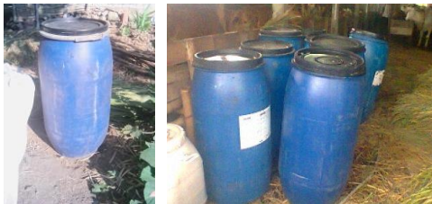
Gambar 10. Buffer Stock Silase

Setelah produk silase yang dihasilkan dari kegiatan ini telah jadi, maka dilakukan penyimpanan di gudang penyangga sebagai buffer stock petani-peternak di musim kemarau. Hal tersebut bisa dilihat pada gambar 10.