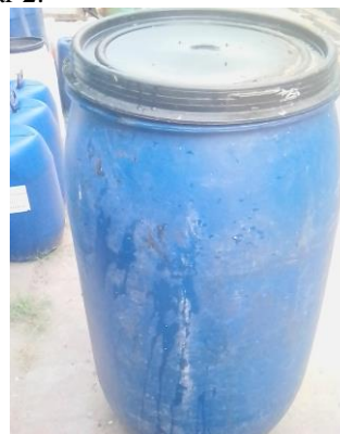
Gambar 2. Silo “Tong Plastik” untuk menyimpan Silase

Persiapan berikutnya adalah penyediaan sarana yang dibutuhkan diantaranya : silo dalam bentuk tong plastik dengan spesifikasi Jenis Plastik : HD Ukuran: 60cm x 120cm x 0.5 cm, Volume : 0.02m 3 , Warna : biru yang disajikan dalam gambar 2.