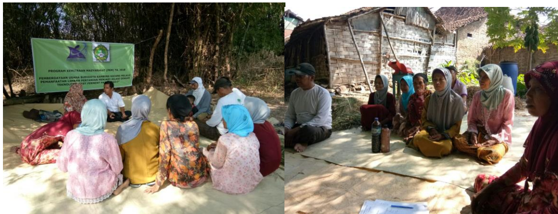
Gambar 5. Kegiatan Penyuluhan II di Kelompok Mitra

Kegiatan penyuluhan II menerangkan materi tentang cara teknis pembuatan silase. Setelah mengikuti kegiatan tersebut peserta lebih paham terhadap cara-cara pembuatan silase dengan teknologi Fast Ferment . Sehingga siap secara pengetahuan untuk melakukan praktek dalam kegiatan pelatihan pembuatan silase.