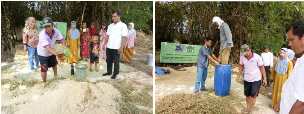
Gambar 7. Kegiatan pelatihan dan pembuatan silase

Prosedur yang dilakukan dalam kegiatan pelatihan dan pembuatan silase di kelompok mitra sesuai Pioneer Development Foundation (1991) adalah sebagai berikut :