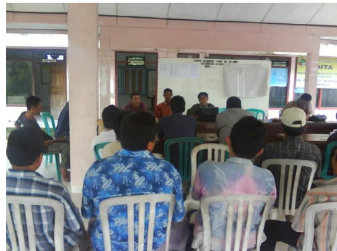
Gambar 1. Sosialisasi Rencana Kegiatan di Kelompok Tani “Rukun Tani II” dan Kelompok Petani Peternak “Telaga Ternak Mandiri”

Hal pertama yang dilakukan dalam kegiatan ini adalah sosialisasi rencana kegiatan kepada anggota kelompok mitra dalam hal ini adalah Kelompok Tani Rukun Tani II dan Kelompok Petani Peternak Telaga Ternak Mandiri. Kegiatan yang telah dilakukan tersebut terlihat pada gambar 1.