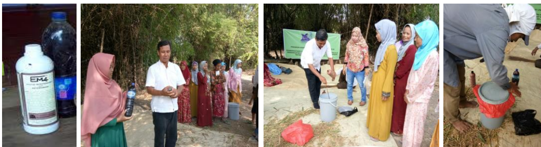
Gambar 8. Kegiatan Perbanyak growth promotor

Salah satu komponen penting dalam pembuatan silase adalah starter yang berisi mikroba pengurai sekaligus sebagai pemacu pertumbuhan ( growth promotor ). Selama ini produk tersebut masih harus dibeli dengan harga yang cukup mahal. Hal ini bisa disiasati dengan memperbanyak starter tersebut. Kegiatan memperbanyak growth promotor bisa dilihat pada gambar 8.