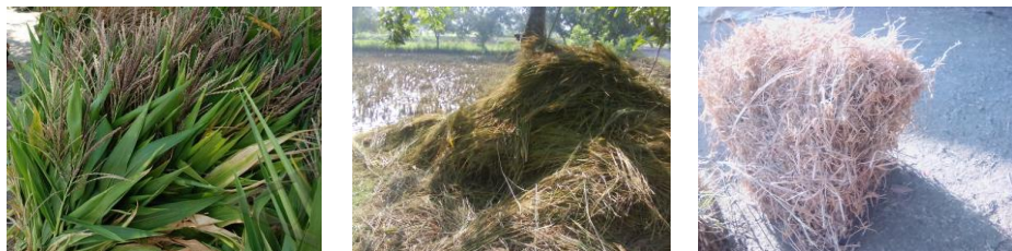
Gambar 6. Limbah pertanian (tebon jagung, jerami padi dan Jerami Kedelai)

Kegiatan pelatihan diharapkan mampu memberikan keterampilan dasar dalam pembuatan silase dengan teknologi yang diterapkan. Pertama yang disiapkan dalam rangka pembuatan silase adalah mempersiapkan limbah pertanian yang akan dibuat silase. Kegiatan tersebut tersaji pada gambar 6.