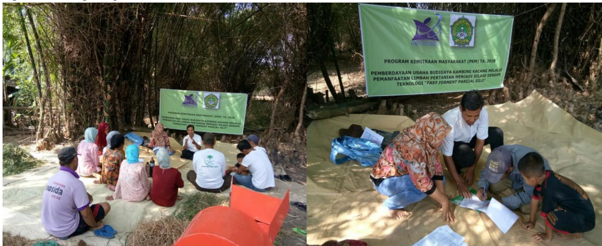
Gambar 4. Kegiatan Penyuluhan I di Kelompok Mitra

Pelaksanaan kegiatan ini dimulai dengan melakukan penyuluhan I kepada anggota kelompok mitra seperti terlihat pada gambar 4.