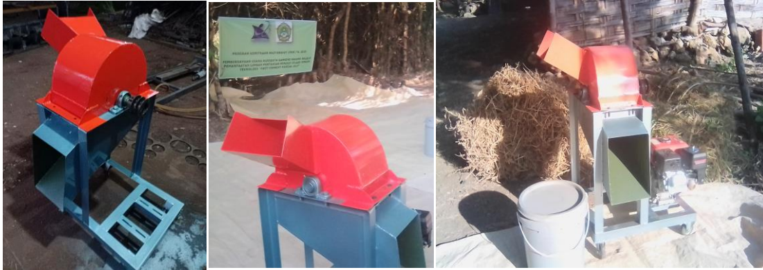
Gambar 3. Chopper beserta mesin penggerak 6,5 HP

kapasitas, bahan yang digunakan dan luas areal yang tersedia. Sarana lain yang dipersiapkan adalah pencacah hijauan ( chopper ) seperti pada gambar 3 berikut ini :